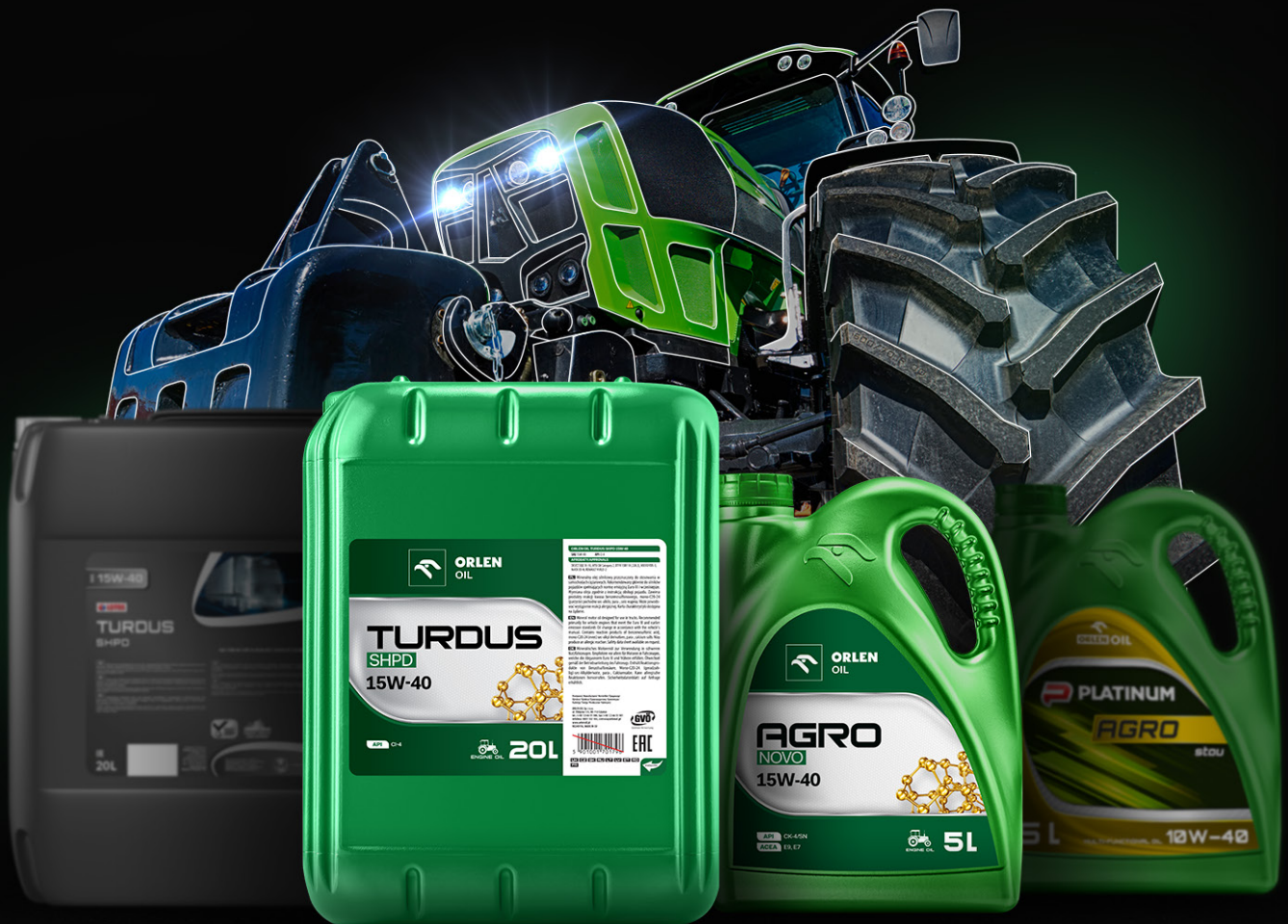
TABELA ZAMIENNIKÓW PRODUKTY DLA ROLNICTWA

Poznaj nową ofertę ORLEN OIL dla rolnictwa