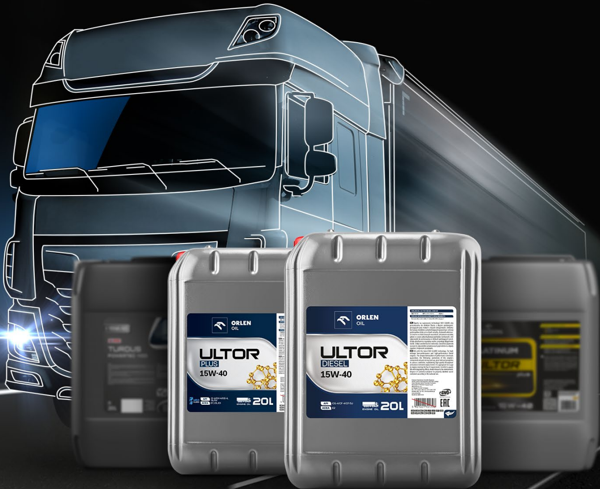
TABELA ZAMIENNIKÓW PRODUKTY SAMOCHODÓW CIĘŻAROWYCH

Nowa, spójna oferta ORLEN OIL jest wynikiem optymalizacji marek, wizerunku i technologii.